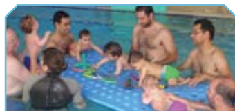
תוכנית הורים ותינוקות