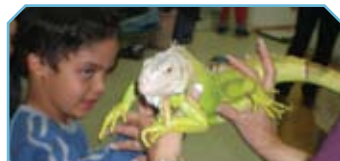
טיפול בבעלי חיים